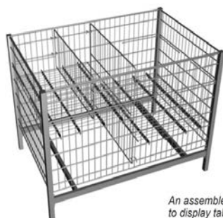
An assembly to display table